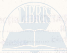
TABLA DE MATERII